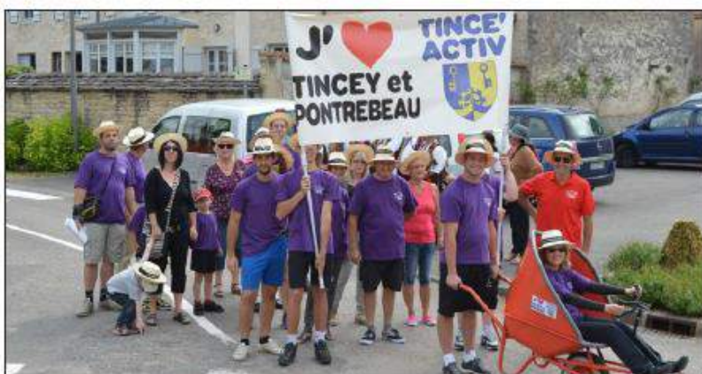
■ L'équipe de Tincey et sa brouette.