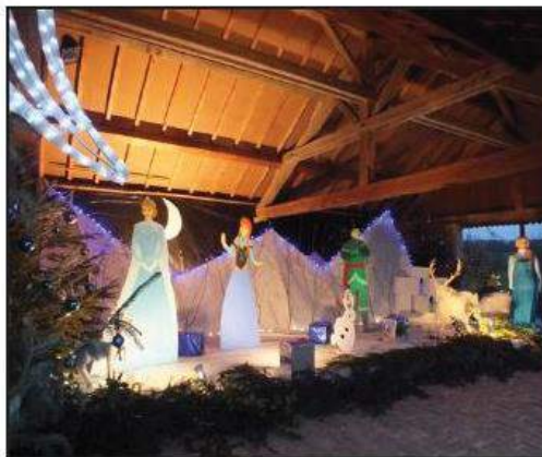
■ Le prochain rendez-vous sera la galette début janvier.

Le prochain rendez-vous de la population sera à l'occasion de la galette début janvier, autre tradition appréciée des habitants.