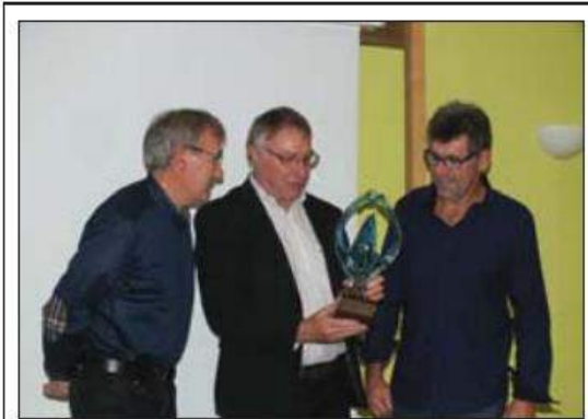
■ Tincey remettra en jeu le trophée le 20 août 2016.