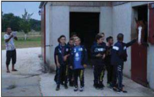
■ Les petits Marseillais ont pu caresser les chevaux.

Les nouvelles structures d'accueil de qualité qui se sont créées dans ce canton permettent de multiplier ces rendez-vous, tant sportifs que culturels.