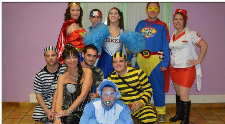
■ Pour saluer l'arrivée de l'hiver, « Tince'activ » avait organisé une « choucroute party » suivie d'un bal costumé dans la salle des fêtes de Renaucourt.

La totalité des enfants ont reçu des bonbons et des petits cadeaux. Toute l'équipe