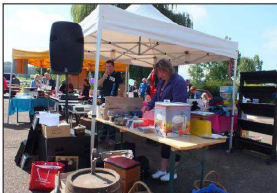
■ Des places sont encore disponibles à 1 euro le mètre linéaire.

Contact : Jennifer Michelin au 06.79.74.26.91 ou 06.89.52.65.52 ou par mail : hisser@hotmail.fr