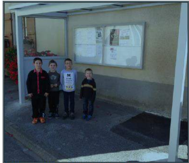
■ Le nouvel abri de bus a été installé devant la mairie.

Encore une heureuse initiative à mettre au compte de la nouvelle municipalité.