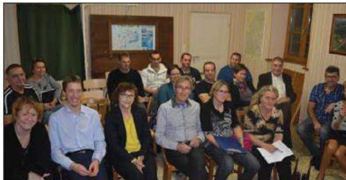
■ La date est connue : les jeux se dérouleront sur la commune le 20 août 2016.

Ces jeux intervillages sont un formidable lien entre les petites communes qui ne souhaitent pas mourir mais au contraire attirer une jeunesse qui ne demande qu'à prendre le relais. Les gagnants des jeux 2016 seront les organisateurs pour 2017.