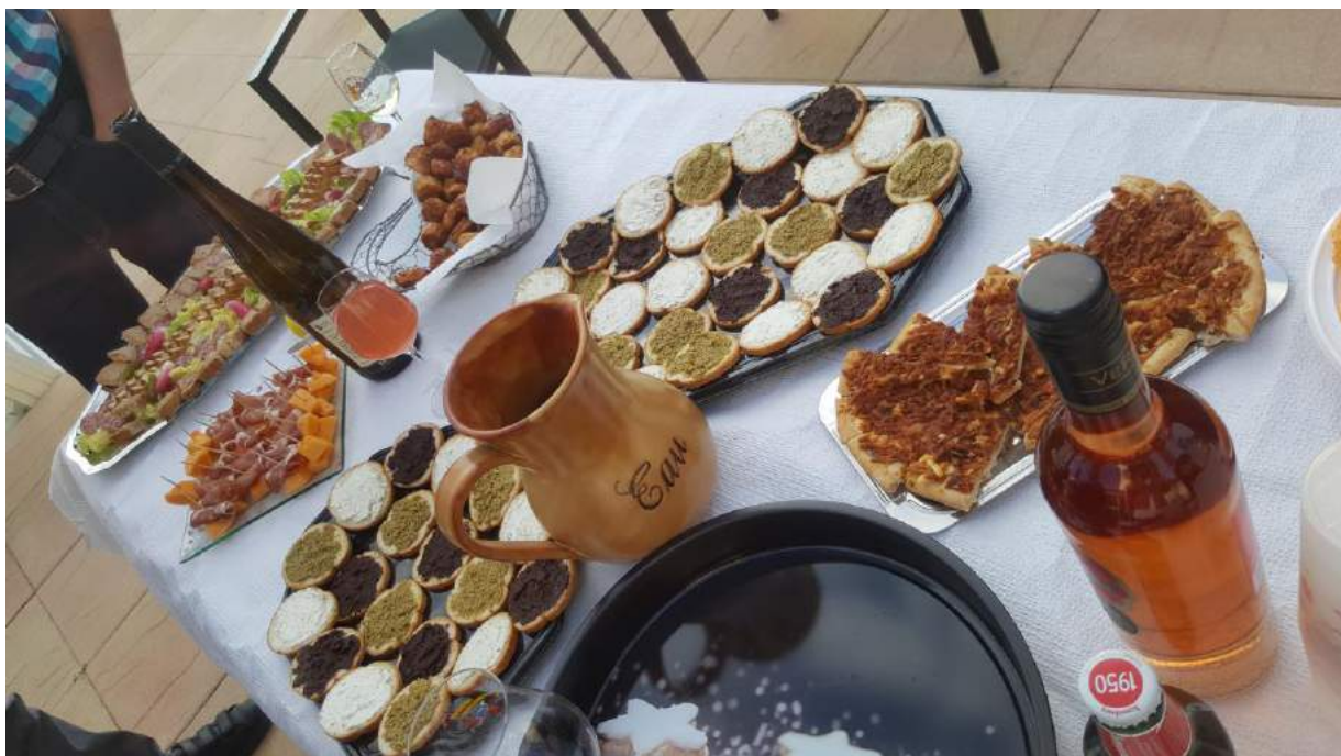
Petite soirée sympathique entre voisins où chacun a confectionné quelques amuse-bouche...